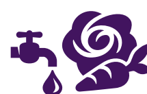
Voedsel- en/of drinkwatermaatregelen