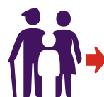
Evacuatie van mensen in een bepaald gebied